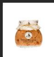
Mayonesa con Tomates Secos Deshidratados